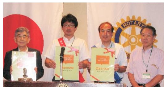
誕生日新聞を手にポーズ!