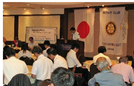
講演に聞き入る参加者の皆さん