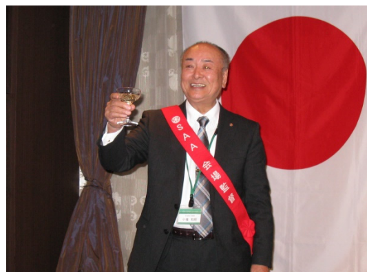
乾杯:小嶺和昭親睦委員